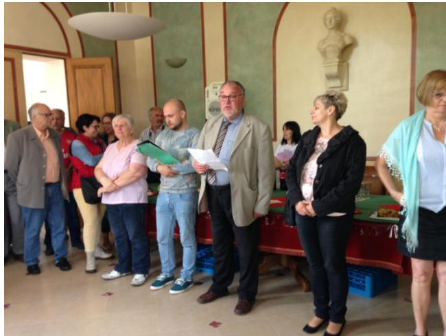
A hivatalos fogadás a Városházán